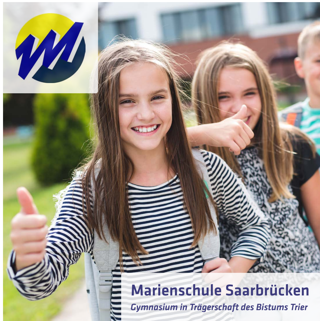
Marienschule Saarbrücken Gymnasium in Trägerschaft des Bistums Trier

Sprachlich besonders interessierte Schüler*innen können neben der Teilnahme an schulinternen Austauschprogrammen auch die international anerkannten Sprachzertifikate DELF (Französisch), Cambridge Certificate (Englisch) und DELE (Spanisch) erwerben.